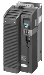
Podobné zobrazení Figure similar

Obj. č. : 6SL3210-1PE26-0AL0 Article No. :