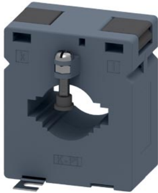
transformátor proudu 600/5A, 5 VA, KI1,0